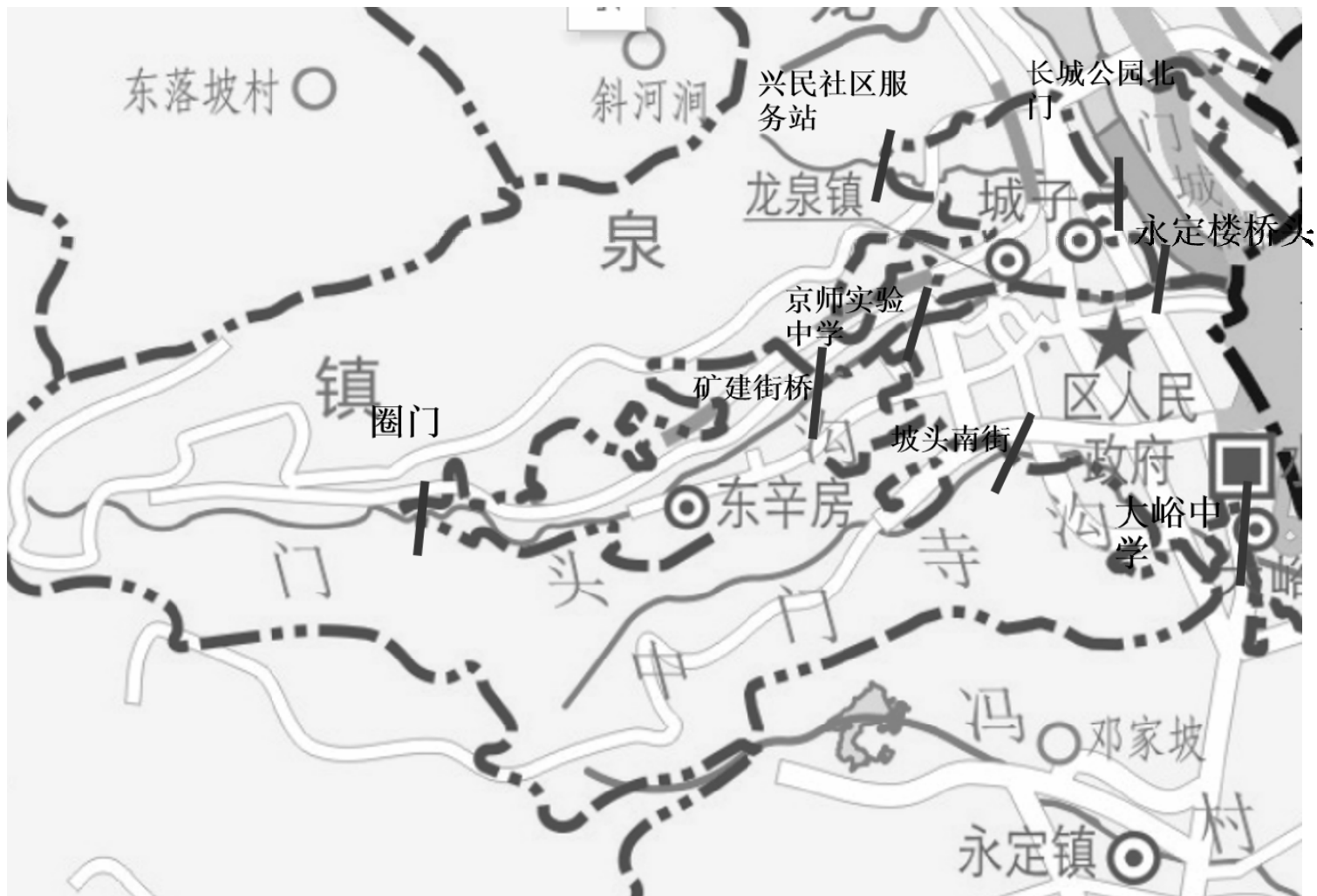
门头沟区龙泉镇、东辛房街道、城子街道、大峪街道水环境跨界断面设置图 (b)